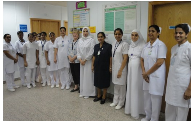
Ward 4 nurses, KCCC Nursing Leadership, &UHN